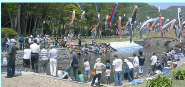
ニジマス釣り堀の様子