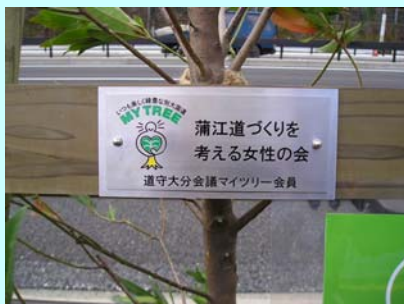
設置したネームプレート

3月10日、別大国道の6車線化を記念して、マイツリー植樹式が行われ、「蒲江道づくりを考える女性の会」の皆さんが参加しました。当日は、25組の皆さんがいろいろな思いでマイツリーを植樹されました。