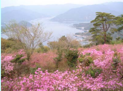
仙崎つつじ公園からの眺望

仙崎つつじ公園は、昭和55年から地区住民と行政が一体となって整備してきた公園で、今では多くの観光客が訪れるすばらしい公園となりました。公園には5万株の「フジツツジ」が自生しており、4月中旬から下旬にかけて、あたりはピンクのじゅうたんになります。現在は、地元の「仙崎つつじの会」の皆さんが管理を行っています。