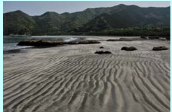
波当津海岸の砂紋

日豊海岸の春の風物誌に波当津海岸の砂紋があります。この季節、潮がひくとききれいな砂紋がよく見れます。3月20日、「春到来！蒲江でふわり癒し旅」波当津散策モニターツアーが開催されました。参加した人からは「波当津の大自然に癒された」、「地元の人との交流が楽しかった」などの声が聞かれ大満足のツアーとなったそうです。 郷土料理おいしかったよ！！