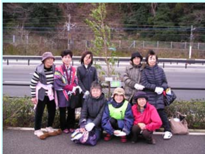
植樹したホルトノキと参加した皆さん