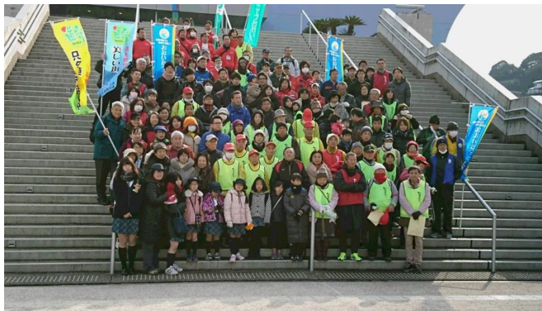
別大国道清掃の様子