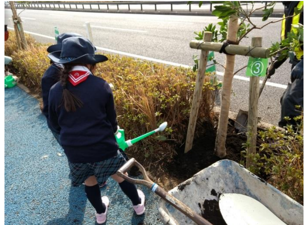
別大マイツリー会員の仲間たち！（128 団体・約 500 名）